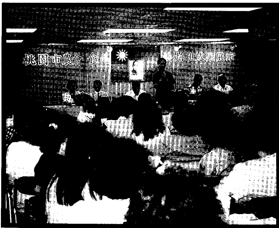
食品烘焙班成果展示，圓滿成功

化活動提供米食、糕點品嚐，所製作的奶油捲、蛋糕、鳳梨酥參加84年度食品優良評鑑榮獲金牌獎，並於5月9日辦理成果展示，深獲參觀嘉賓好評。