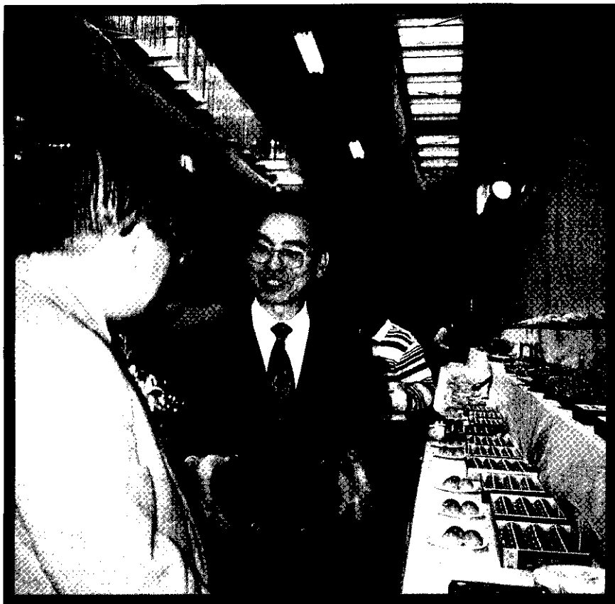
農漁村文化活動中，學員們一展身手，推出的點心，深獲好評

商業急遽發展，農地面積逐年減少，農村人口外流嚴重；農業收入跟不上工商業收入，農民只靠從事農作，維持生計困難，必另謀出路，如今面臨 GATT 即將入關，更可說是雪上加霜。