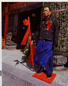
糾察官在廟門前站崗