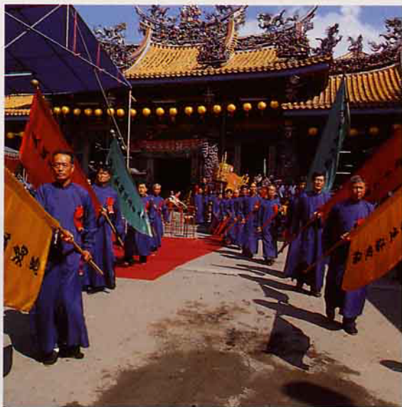
持旗列隊行進將至牌樓前