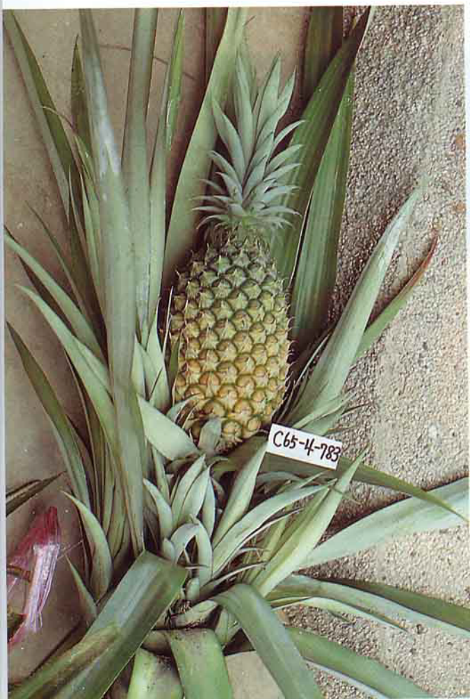
台農16號，又名甜蜜蜜鳳梨，葉緣無刺，方便田間管理