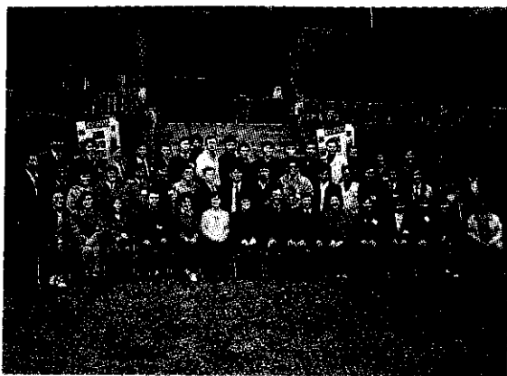
參加幹部聯誼會的人，在霧濛濛中來個全體合照