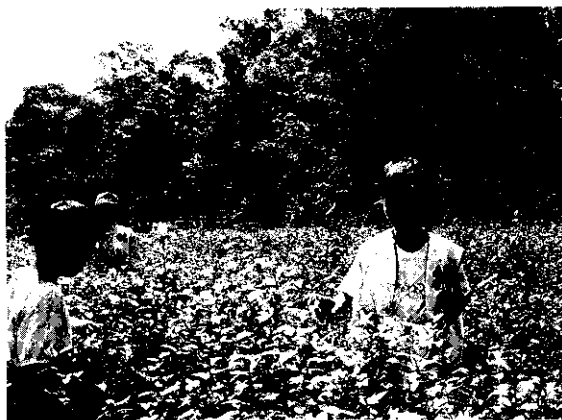
學習摘茶、製茶，才知道做農的辛苦

知道茶農的辛苦；在大太陽底下必須採一整個茶園的茶葉，採完以後，還有室外萎凋、室內萎凋、殺菁、揉捻、烘培等……一些手續，有時候還要整夜工作到第二天才可以休息，實在是非常的勞累和辛苦。所以我在採茶和製茶的時候，非常的認真，每一種手續我都設法參加，可是有二個過程我沒有參加，真是可惜。