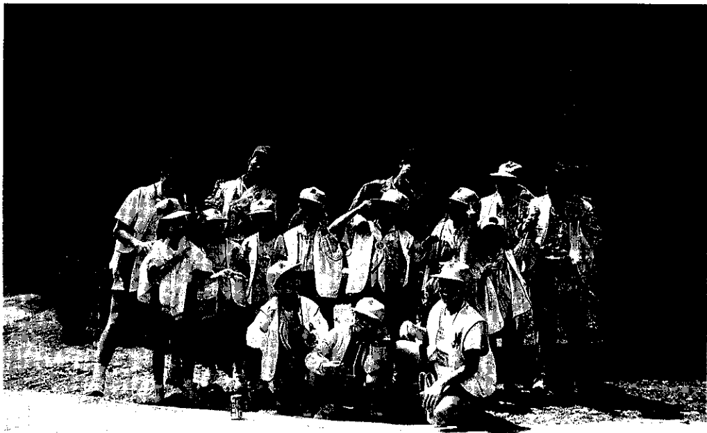
活潑可愛的四健會員於杉林溪藥用植物園合影

習，一直到了要結束時，我打出了一個長達10分鐘之久的旋轉陀螺，再來我又打出了一個五花八門的旋轉，它先停在空中一下子，掉到地上畫了20個直徑1公尺的大圓圈，又跑到中間一直轉，轉得泥土都凹一個洞，後來被別人踢停了，但時間也到了，我只好告別這陀螺時間。