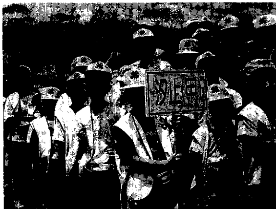
我們是一群小小四健會會員