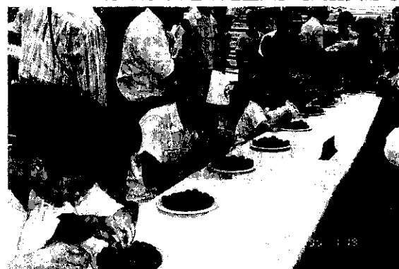
吃葡萄比賽趣味十足