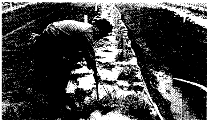
插稻草樁，林助理在本田期作業情形