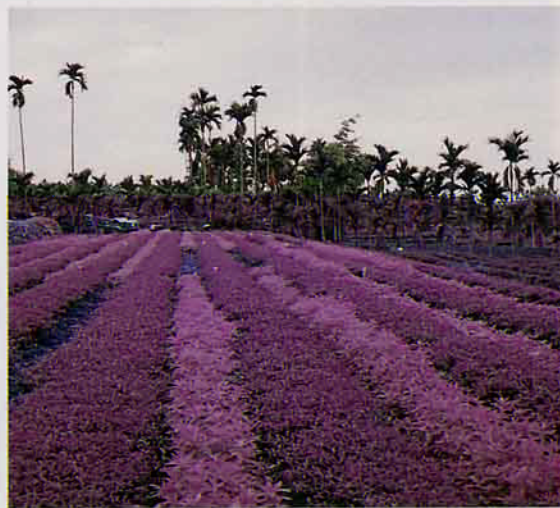
茶園間植綠肥作物