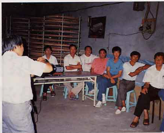
產銷班茶農齊聚研究製茶技術