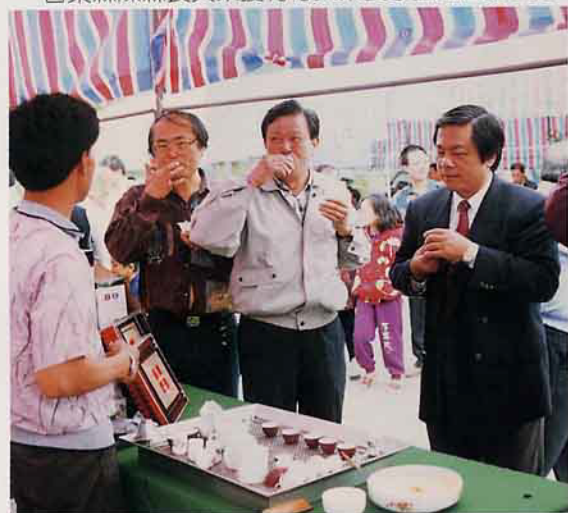
台東縣陳縣長關心茶葉推廣及產銷情形