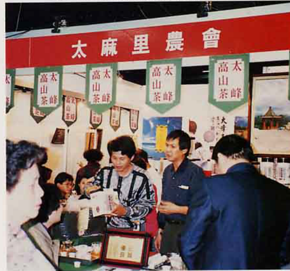
太麻里地區農會輔導茶葉產銷班辦理促銷時之人潮