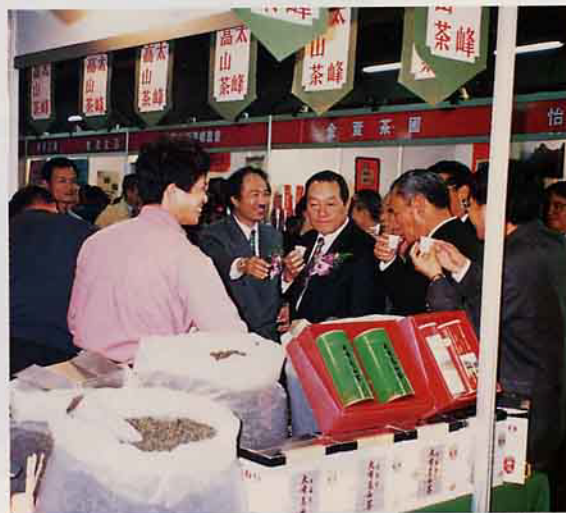
農委會主委孫明賢稱讚太峯高山茶品質絕佳