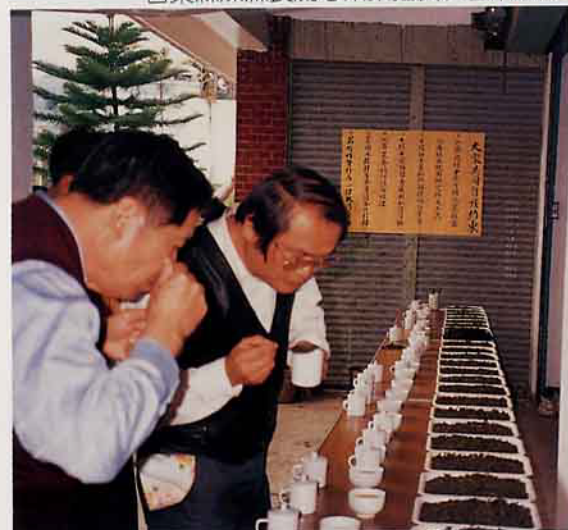
國寶級評茶師省農林廳張技正(圖左)與茶改場台東分場長陳博士(圖右)共同為太峯高山茶把脈