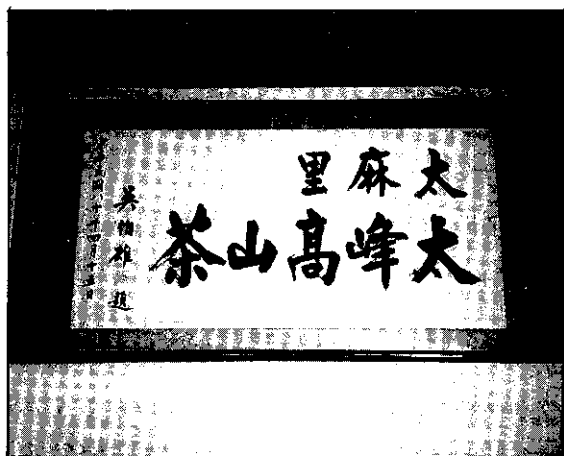
鎮山寶物「太峰高山茶」

台東縣因境內千山萬巒、山明水秀，空氣、水質清新良好，可說是台灣地區碩果僅存的人間淨土，而頗負盛名具有台東觀光指標的『知本溫泉』及『金崙溫泉』等多處之森林遊樂區，即與出產太峰高山茶的金針山同屬一區，有識的茶農們要使太峰高山茶能與知本溫泉馳名中外，使茶園能永續經營，則應具有作好水土保持，