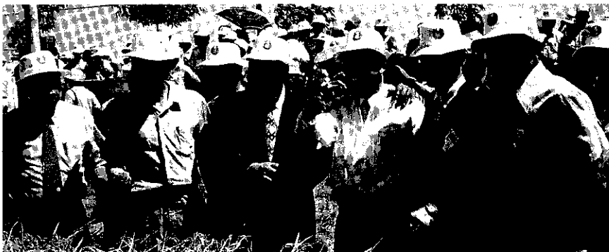
農林廳廳長邱茂英(前右三)參加良質米觀摩會，對本省稻米品質的提昇，極力推動

我國即將加入關貿總協，為讓農政人員及農漁民朋友了解農業方面所採取之因應措施，行政院農委會及農林廳從4月20日起已連續在全省各縣市辦理廿一場次座談會，邀集全國農業有關人員共同研討，會中將政府已研擬之農業因應對策，一一向與會人員說明。期讓全國農業人員以及農漁民朋友充分了解，增進其對農漁業建設之信心。