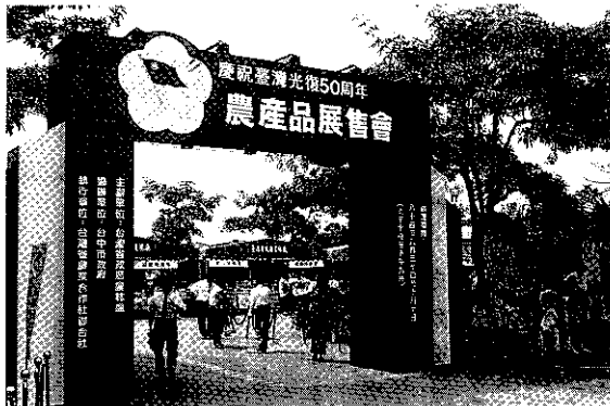
展售會會場設在台中市假日廣場

這次活動分有四部分：一為農業建設成果展；二為農產品展售會；三為農漁村文化活動；四為農民運動會。（如附表）