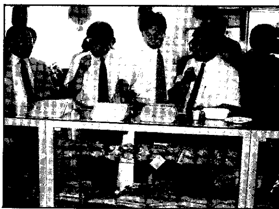
日本千葉大學宮崎清教授等一行參觀鮑蔴加工處理中心，品嚐金棗加工品

本公司創立於1980年·產品遍佈國內外各地 引進國外先進技術·進口冷凍機組最耐用 智慧型溫控器最安心·高密度保溫材最省電 通用冷凍設備公司 地址：高雄市中華路一段2131號 TEL:(07)3121589·FAX:(07)3231669