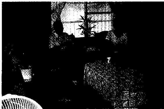
林場長認為台灣農家要覽對農民有很大的益處

知識是經驗的累積，書籍是典藏人類智慧的寶庫，所以總是說書是人最好的朋友，能鑑往知來，台灣的農業技術，在這套書做一個世代交替的傳承。