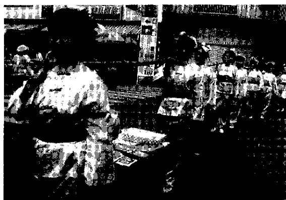
家政班招，嫁妝十二格

古式民俗婚禮，新郎騎馬，新娘坐轎，媒人坐三輛車，由地方老輩吹八音及鑼鼓陣；家政班抬嫁妝十二格，亦有尾後擔，仿古儀式，隨行有各陣頭遊街一個多小