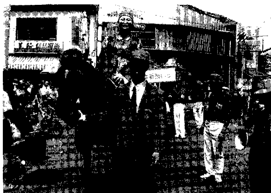
新郎騎馬新娘坐轎