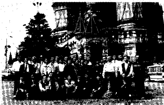
脫離共產體制的俄羅斯，已今非昔比

物館及93處運動場，教育至為普遍，且教育水準亦非常高。參觀克里姆林宮、博物館、國會大廈廣場及中央百貨公司。