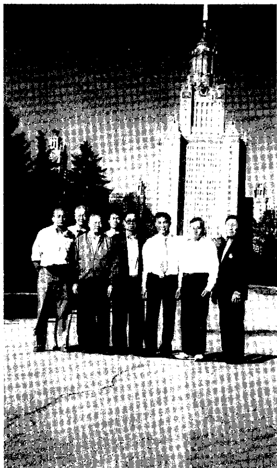
莫斯科大學前(右四為筆者)

馳名達百年以上蘇聯，非但是世界第二強國，更是全世界共產國家領導國。蘇聯係由15個國家組成一個蘇維埃政府聯邦共和國，該國土地之大堪稱世界之冠（比台灣的面積約大600倍），但大部份土地均屬冰天雪地，鳥不生蛋之地，故地廣人稀，人口僅有兩億4千萬人。