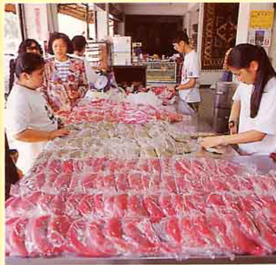
對面商店專賣紅龜粿