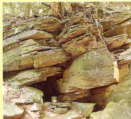
添丁洞為廖添丁葬身之處，模樣像極石棺