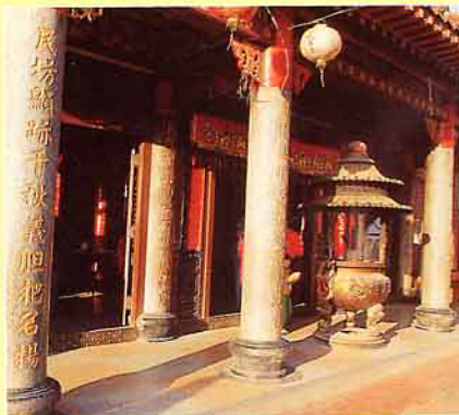
廟柱皆刻有對聯字句