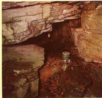
添丁洞穴前有香爐、酒杯等，供人祭拜