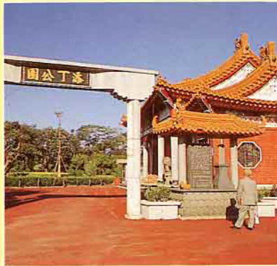
添丁公園入口與碑亭