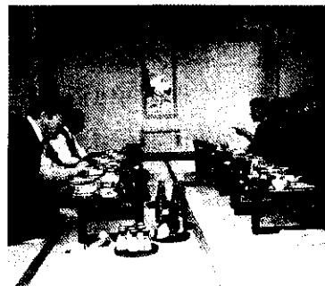
聚餐時，雙方仍不忘交換意見