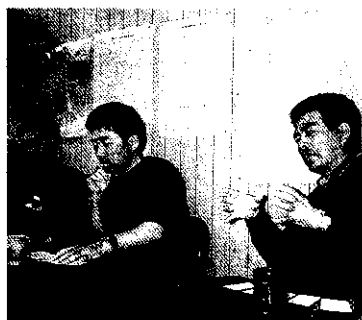
黃金崎農場人員說明組織經營的過程