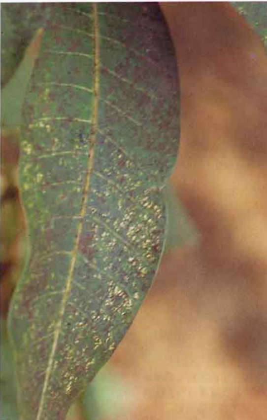
葉蟬刺吸葉片情形