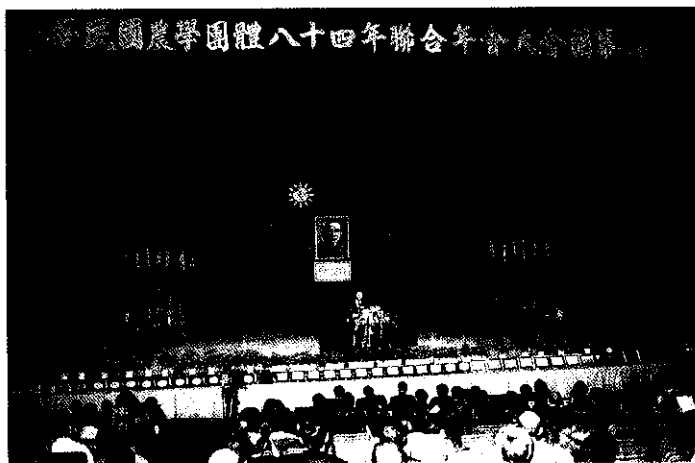
中華民國農學團體在中興大學惠孫堂舉行開幕典禮

中華民國農學團體於12月15~17日在中興大學舉行84年度聯合年會，總統府資政蔣彥士、台灣省省長宋楚瑜、農委會主委孫明賢、農林廳廳長邱茂英等多人蒞臨致詞。大會亦表揚農業有功人員，包括林業、水土保持、土壤肥料、植物病理、園藝及農業推廣等方面，共計56人。