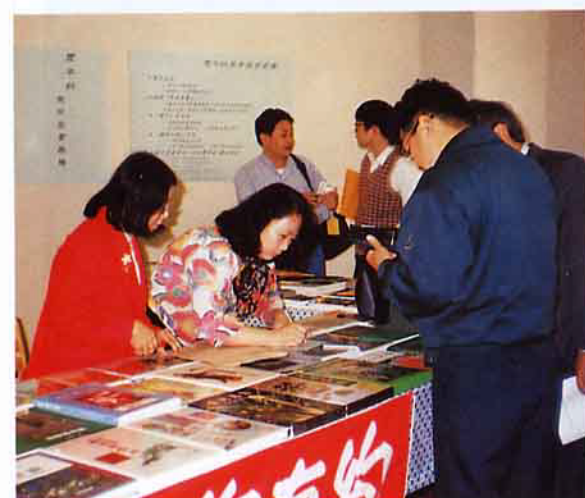
本社圖書展售吸引不少人前往採購