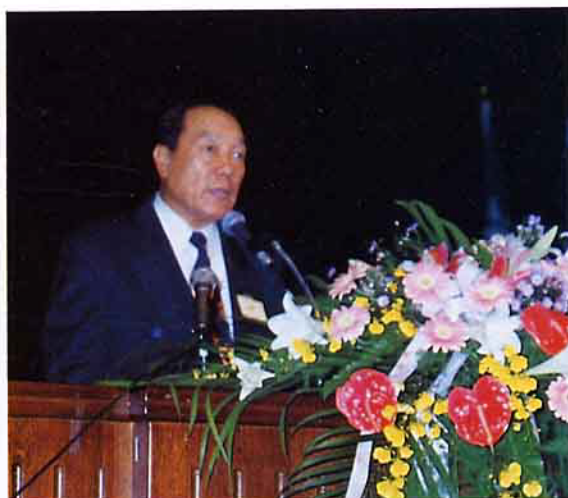
農委會主任委員孫明賢表示國際合作是未來潮流