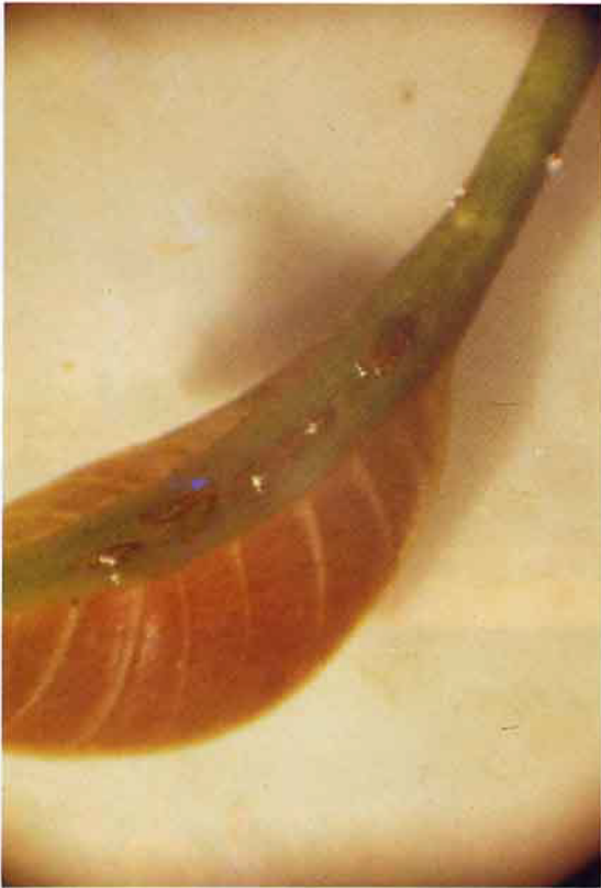
葉蟬產卵於葉脈情形