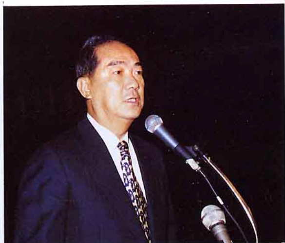
台灣省省長宋楚瑜表示台灣的農產品運銷要再加強