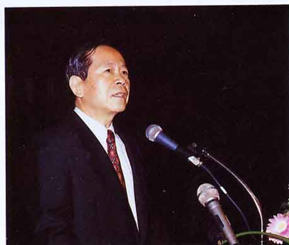
農林廳廳長邱茂英主持年會中心議題之報告討論