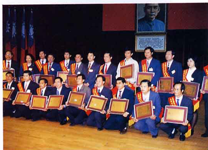
優良農業基層人員受獎後合影