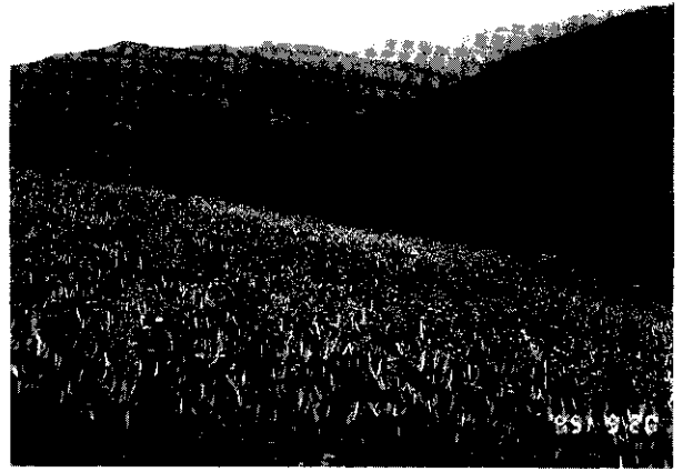
青山綠水才是金針山最大的本錢

金針山目前生產金針菜的情況是如何？套上一句俗諺：『滄海桑田』，應可喻為世事變遷，好景不常的最好說明。依據台灣省政府農林廳最新編印84年版『台灣農業年報』所登載的資料顯示，台灣地區金針菜種植面積僅餘1,000公頃，而台東縣的544公頃中，主要產地的金針山就占了450公頃，雖仍獨占鰲頭，唯盛況已不再；原有種植金針的區域，已因陸續的轉作高山茶，還有部分的粗放經營，甚至荒廢，故實際上繼續經營以食用為主的金針菜面積僅200餘公頃，通盤來論，其實這是全省性的問題，金針山是無法倖免的，因此這與昔日壯觀規模的比較，有如天壤之別，而這些現象從台東縣政府所編撰『台東縣84年度台灣地區金針花調查結果報告』中，可略知原因一、二。