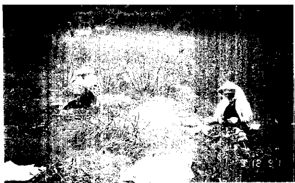
林野中的紅寶石(太麻里地區名產洛神花採收情形)

、波羅密、洛神花等水果、特產的種類與產量亦甚為豐富，而毗鄰的中央山脈內陸的區域，更有茂密節原始森林，在這廣大山坡中，不少的榕樹、相思樹、楠樹、月桃、蕨類、菇婆芋等天然野生植物羅列其中，林野中還不時有山猴、班鳩、松鼠、畫眉鳥、竹雞、老鷹等鳥類及山豬等野生珍禽野獸穿梭出沒，再加上零星散落道路兩旁及耕地中的農宅聚落點綴整個金針山區，構成了一幅景色宜人，多采多姿萬物有情的世界，猶如一位未曾濃妝艷抹的鄉村姑娘，沒有人工鋪排，很自然、很耐看。如今金針山對外交通的大動脈，也由昔日路況欠佳的羊腸小徑，逐漸改善以路面稍寬的4公尺半水泥路面—佳崙產道路及其延續的幹一線、幹二線取而代之，雖然路況仍差、道路密度又嫌不足，但比起以往已算是很大的進步，在此金針山神秘的面紗逐漸褪去之際，隨著對外交通稍為改善的同時已漸為人知。實際上金針山山麓下的太麻里地區，原來就是一個物產極為豐饒的富庶之鄉，其轄內廣栽之935公頃的釋迦、416公頃的可可椰子，及2、3百公頃的梅、李、桶柑、荔枝等果樹，與通