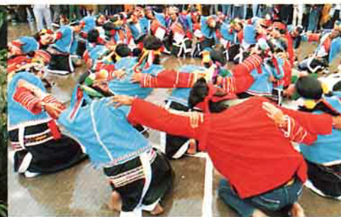
鄒族婦女歌舞演出