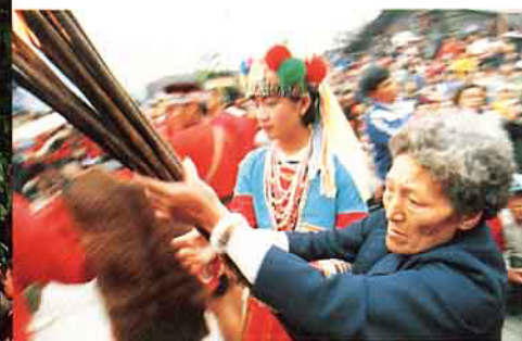
氏族家中火炬入場

除草祭、收割祭、敵首祭（早已杜絕）、狩獵祭、男子聖所修築祭、家屋落成祭、幼年同年禮、成年禮等儀式，多於年終粟祭時合併舉行，簡稱年祭，如今則稱豐年祭。到了今日鄒族部落最重要的祭儀，為播種祭、收穫祭與瑪亞斯比祭典等三大祭儀，瑪亞斯比豐年祭原意是戰祭，這是古時為了祈神助佑出征勝利及求神恩賜民族團結而舉行的祭典。古早祭儀多，持續十多天至一個月，且祭典日期未固定，通常在每年8月收割舉行，日據時統一在每年國曆8月15日起三天，如今達邦、特富野（82年改）豐年祭，皆在每年2月15日起