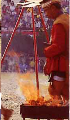
向代表族人生命之火聖