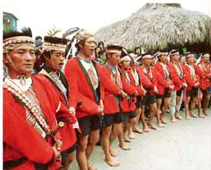
男子牽手載歌載舞

迎神祭舞唱後，進行「團結祭」，與祭者進入聖所，祭豬亦抬入神座下方，大家將神花取下沾豬血插在神座上；各氏族派人取來小米酒、小米糕與豬肉，混合分食，表示全社各氏族精誠團結。然後主祭者將上次祭典後出生的男嬰，奉在神櫃前，介紹給神認識，讓神賜福，主祭者更介紹族內歷代英雄故事，與各氏族的歷史，讓與祭者歌頌。