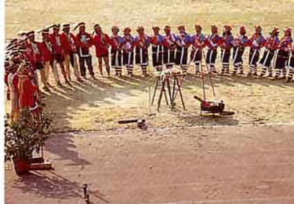
與祭者歌舞圍成半月形

主祭者傳令神花木柃蘭（壯丁一早上山採得一大袋）進場，將神花分給參與者插在皮帽上與腰間，可避邪潔淨場地，然後主祭者呼眾面對神樹，抬小豬一頭代替人頭，置神樹與眾人間，與祭者腰刀紛紛出鞘刺入豬身，刀尖沾著豬血，隨即舉刀向神樹作呼嘯狀，並沾血於樹葉，接著數人爬上神樹砍掉枝葉，僅留朝向會所與汪、石眾的三枝葉及樹幹，據說砍樹是造戰神降臨的梯子，或除去惡靈所沾附枝葉，或防止神樹太過高大。之後與祭者圍成半月形的舞圈，由主祭者帶頭唱迎神歌，並以緩慢的慢四拍舞步，請戰神以神樹為梯下降人間。