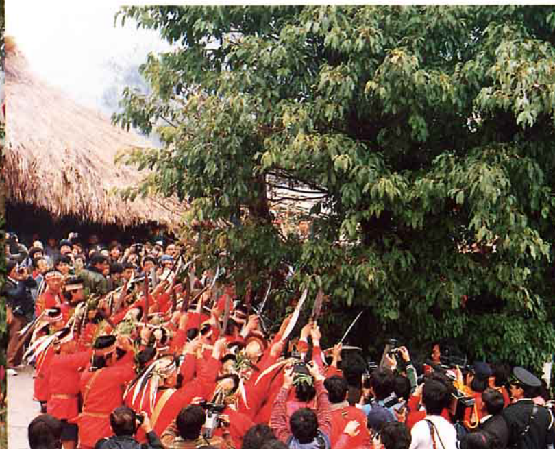
舉刀向神樹作呼籲狀