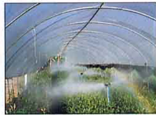
溫室花卉施肥實況