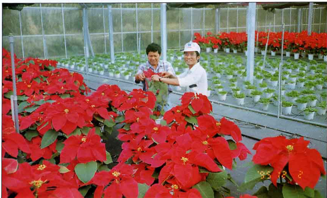
聖誕紅共同產銷，班員一起幫忙出貨的情形

新屋鄉位於桃園縣與新竹縣的交界地帶，臨近海邊。以往之農業以生產水稻為主，因有石門水庫灌溉系的幫助，其所生產之稻米，米質優良，素有桃園米倉之稱。以前雖然有也少數農家轉作花卉，但成立花卉班是近幾年的事。