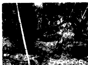
(一) 種植時可當一般容器使用，滲水力強，對於不易移植或移植有障礙之樹種特別有利。

庭木移植的新趨勢 栽培容器的新選擇 移植庭木的好幫手 移植搬運簡單又方便 不受移植影響而可永保長綠