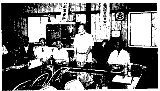
行政院農業委員會孫主委蒞臨指導產銷班

當時的種植面積及總產量高冠全台，分創各占81%及72%的佳績，為台東特產推廣成果寫下光輝燦爛的一頁。但可惜的是當時農產運銷制度仍未臻健全，每由商販直接至各生產農戶田間批購，由於銷售管道受制於人，故售價一直無法提高，果農沒能得到應有的利潤，再加上內、外銷景氣不振，以至價格滑落，終在全省性黃龍病（立枯病）的侵襲肆虐下，甚多果樹罹患落葉、梢枯，致全樹生育衰弱死亡，嗣後美國的香吉士果汁和鮮甜橙接二連三大量進口衝擊的多重影響下，使多數果農失望無心經營，將果園任其荒蕪或改種其它作物，至此台東縣晚崙西亞種植面積逐年遽降到民國75年時的43公頃，總產量僅餘19公噸的最谷底，且所剩下的果園經營規模已較小，效益又不彰紛紛廢耕轉作，此時整個台東縣的晚崙西亞產業已面臨奄奄一息。