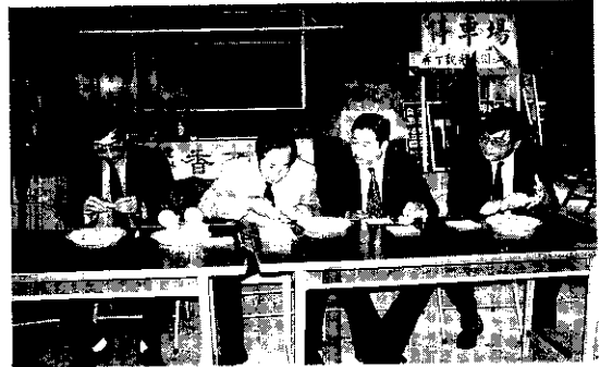
農林廳邱廳長品嚐香丁