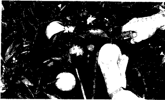
花與果同時存在是晚崙西亞獨具的特色

施，便利作業以降低產銷成本，並加強施用有機質肥料及強化安全用藥觀念，終在果農努力經營及各方協助下，品質已大為提升，就以目前台東縣所實施果品上、中、下級的分級制度，平均批發價每公斤皆40元、30元及20元以上，且供不應求，已較政府未輔導前，不論好壞一律以每公斤僅約12、13元價格之整園批購方式，及盛產滯銷果農血本無歸的情況，簡直不可同日而語。足見產銷經營班輔導、果品分級制度及相關推廣計畫的成功，也因此使果農又再燃起希望，故種植面積截至83年底止，逐漸恢復到84公頃，產業雖小，但面積與產量已超過全台半數以上，再次高居榜首，因其能符合現代少量多樣化消費需求，已儼然再度成為台東縣具有代表性的農特產。