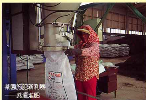
茶園施肥新利器 ——蔗渣堆肥