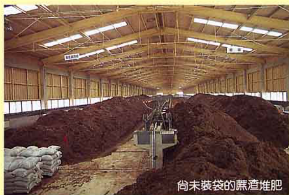
尚未裝袋的蔗渣堆肥

台糖公司虎尾總廠為配合政府農業政策，積極研發『蔗渣堆肥』，以改善土壤，帶動有機農業，提昇農作物品質，最近在南投縣仁愛鄉屯原山地茶區陽大笠茶園進行蔗渣堆肥試作，經證實蔗渣堆肥在