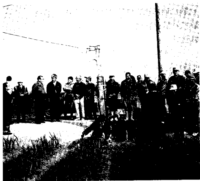
農友觀摩，劍蘭園施用蔗渣堆肥的好處

虎尾總廠有鑑於「蔗渣堆肥」在蔬果花卉作物方面已有很好表現，如能施用在茶園，對提昇茶葉質量將有很大助益，故於去年9月，在該茶園試作蔗渣堆肥對茶葉產量及保水保肥力觀察試驗，在茶園中耕施肥時，每公頃施用蔗渣堆肥10公噸，條施混入土中，其後各項肥培管理作業與一般茶園相同，經多次觀察，施用蔗渣堆肥區，茶園郁郁青青，葉面亮麗，葉質細潤，生長勢旺盛，對照區，生育較緩慢，葉片小而厚，質堅又粗糙，葉色較淡。本 →