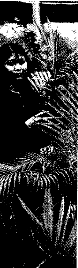
棕櫚科植物品種圖

棕櫚科植物中袖珍椰子、圓葉蒲葵適合室內栽植，此外豪威椰子、肯氏椰子及棕竹類等屬於較耐陰的植物；而耐陰性中等的椰子有黃椰子、雪佛里椰子及叢立孔雀椰子等；至於華盛頓椰子、加拿利海棗、海棗、叢櫚及可可椰子等屬於陽性植物。黃椰子及肯第亞椰子等之羽狀葉與棕竹、山棕及蒲葵等之掌狀葉可做切葉，為插花優美素材。觀音棕竹及黃椰子因葉形優雅，其柔和的曲線，能表現清新與自然的情境，在插花葉材利用上深受歡迎，為僅次於蕨類的主要葉材。棕櫚科植物種類及品種繁多，不但可供庭園栽植，更是觀葉及切葉植物中極為重要的一科，即使在溫帶地區的荷蘭，其1988年暢銷盆花排行榜上棕櫚類植物亦高居第三位。雖然棕櫚科植物適合本省南部栽植，但本省有關棕櫚類植物並無系統的蒐集及開發，有鑑於此，本計畫擬有系統的蒐集本省現有的棕櫚科植物，調查其生長習性與園藝性狀，期能從中篩選出適合本省觀賞用之棕櫚科品種。