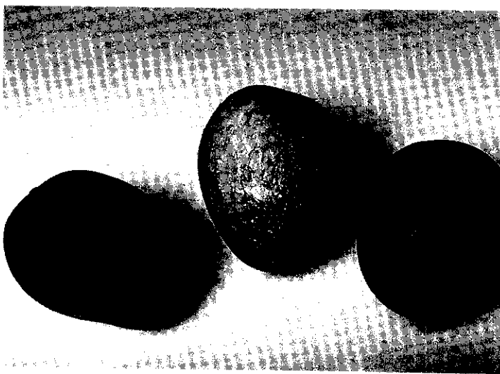
愛文芒果外銷到香港，被稱做「台灣奇果」

芒果在台灣並不是一種新的水果，栽培歷史可追溯到400年前。荷蘭人佔領台灣時引進的品種稱為本地種，日據時候引進的稱為南洋種，這兩大類的芒果品種，各有其優異的特性，缺點則是果色黯淡而不够鮮艷，產量欠豐而不能供作企業性的