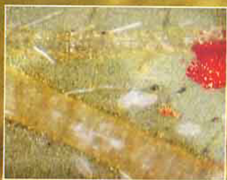
莖潛蠅的白色虫卵