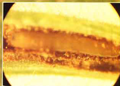
植株莖中潜伏莖潛蠅幼虫