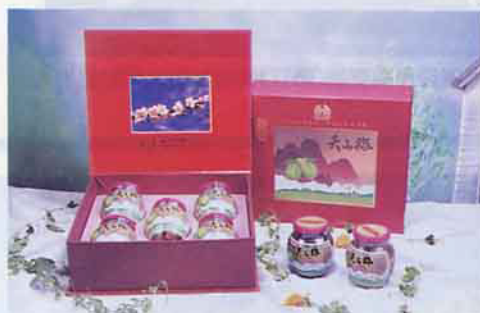
“郡坑天山梅”系列產品，精美高尚