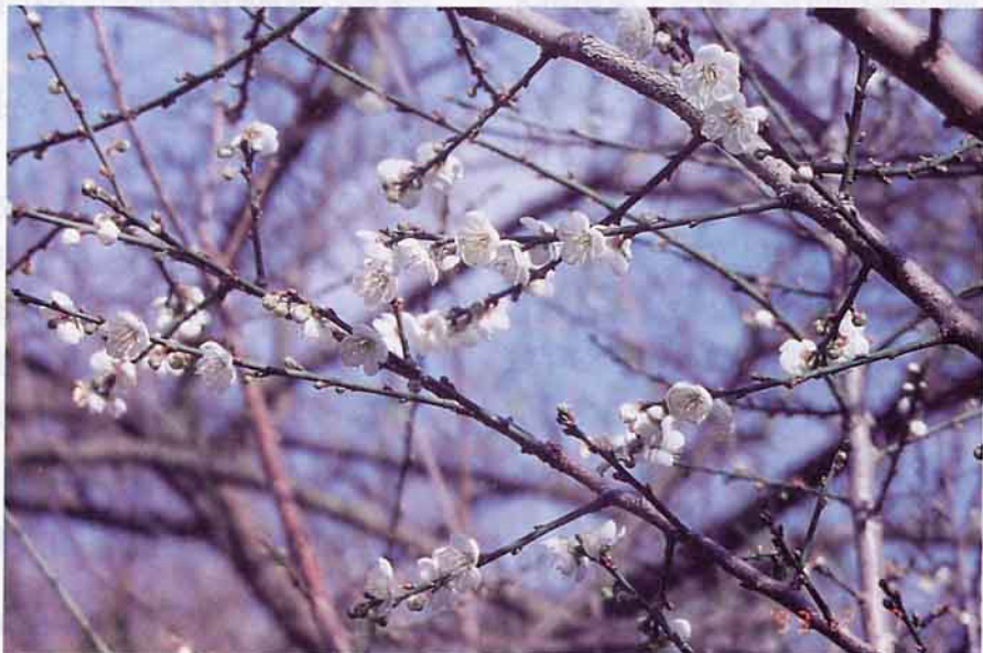
郡坑青梅產銷班全體班員以梅花堅忍不拔之精神從事梅產業經營