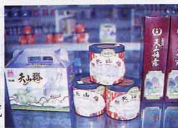
設計精美之梅系列產品

註：梅子受天候影響甚大，其產量無法穩定成長，如84年度青梅產量因受去年道格颱風及暖冬影響，生長受損，開花減少，且農民因量少而缺乏管理意願，青梅品質不佳，價格下跌。故梅樹改良為目前研究改善之急務，假若能克服解決，其成長潛力尚大。