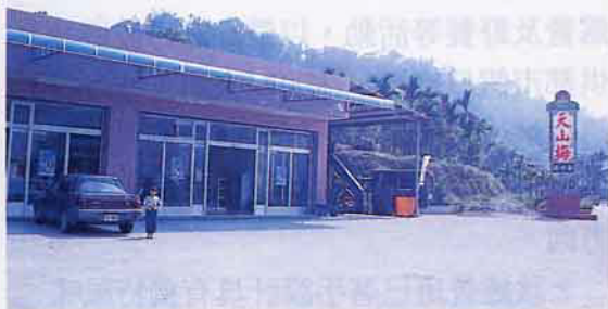
“天山梅”門市部外貌