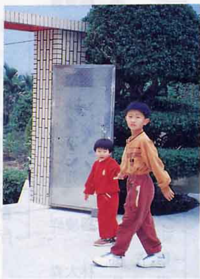
民宿大門常開歡迎光臨