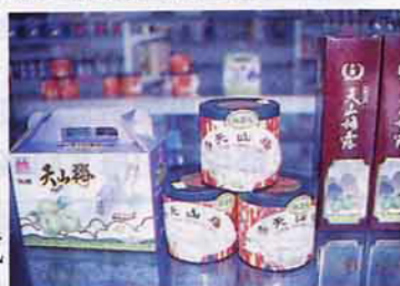
設計精美之梅系列產品

註：梅子受天候影響甚大，其產量無法穩定成長，如84年度青梅產量因受去年道格颱風及暖冬影響，生長受損，開花減少，且農民因量少而缺乏管理意願，青梅品質不佳，價格下跌。故梅樹改良為目前研究改善之急務，假若能克服解決，其成長潛力尚大。