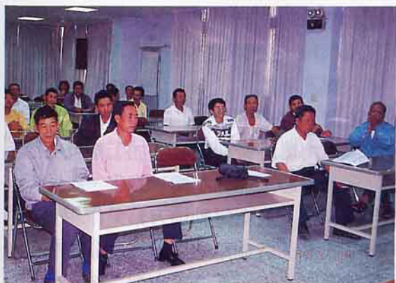
產銷班員參加講習會

1.由於梅樹皆有適當管理，致促使產品品質好，梅果無斑點、果粒大、無破損、售價提高。近年來加工部經精選之上等青梅價格平均已有明顯上升，提高班員收益甚大。並因為加工部對原料青梅開價高，商販只好隨行情買賣，有助於帶動梅產業（表3）。