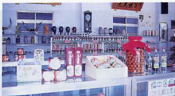
“天山梅”門市中，出售的梅加工產品

—積極拓展銷售管道，例如與風景區特產店、超市、機關福利社及百貨公司等合作、建立行銷網以推展“天山梅”系列產品。