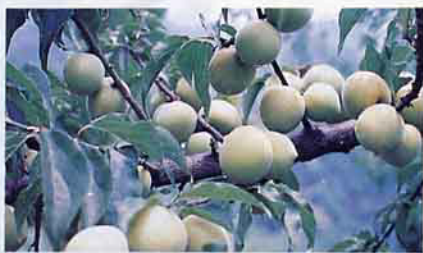
梅花開後結實纍纍的梅子等著您來趟天山嶺採梅之旅，好玩吧……

欲參加今年產銷班的採梅、製梅活動（85年2月～4月底止），請即刻報名，報名專線049-821028 傳真049-821521。