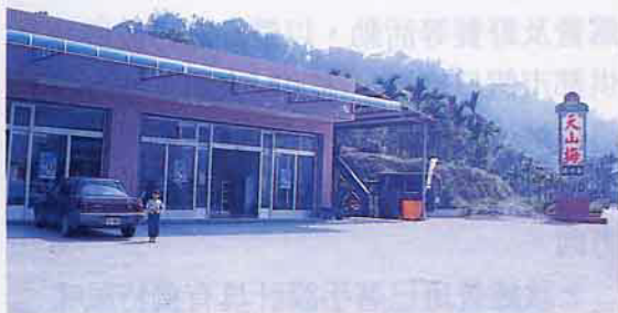
“天山梅”門市部外貌