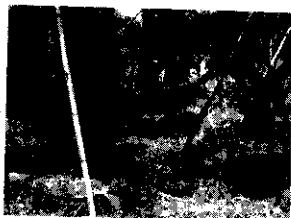
㊟ 種植時可當一般容器使用，滲水力強，對於不易移植或移植有障礙之樹種特別有利。

庭木移植的新趨勢 栽培容器的新選擇 移植庭木的好幫手 移植搬運簡單又方便 不受移植影響而可永保長綠