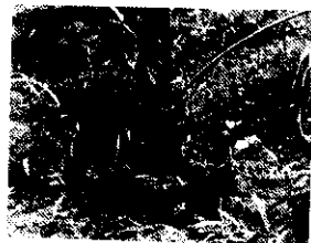
㊟ 移植時可保留大部分枝葉樹型，生長不受影響，永保長綠。