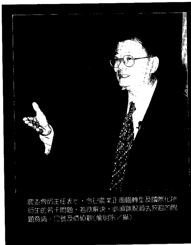
農委會副主任表示，今日農業正面臨轉型及國際化所衍生的若干問題，若欲解決，必須跳脫過去狹隘的問題意識、口號及價值觀

波森馬特勒顧問公司的李夫說：「如何面對問題是公關顧問行業中成長最快的項目」。曾經在一九七七年採訪過北海艾卡菲士克油田爆炸事件的一位挪威記者回憶說，當時因為非利浦石油公司挪威經理在記者會上無能的表現且拒絕回答一些率直的問題，使記者們倍感挫折與不滿。他指出：「既然記者會予人一種亂糟糟的感覺，那麼我想他們處理爆炸事件的情況也好不到那裡」。