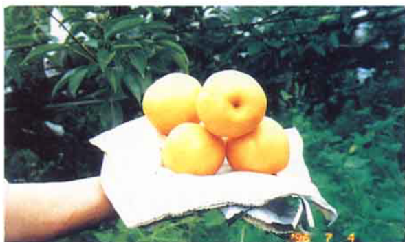
打開一袋觀其果實，極其漂亮

「田力寶」的成份是含有4種工程菌和2種能源菌，工程菌是固氮菌、解磷菌、解鉀菌和解煤矸石菌，能源菌是生物素發酵菌和丙酮酸生成分解菌，這六種菌施用在土壤中後，互相依存作用，而達到固氮、解磷和解鉀等功能。農友在土地上努力照顧作物，「田力寶」，這種微生物產品，則幫助農友在土地下賣力幹活，它能夠深入農友能力無法所及的微