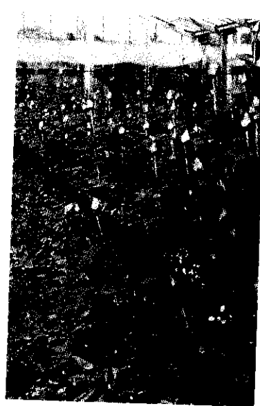
撚枝玫瑰田間生育情形