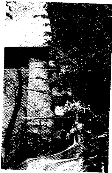
利用岩棉作為栽培介質以滴灌方式 培育撚枝玫瑰