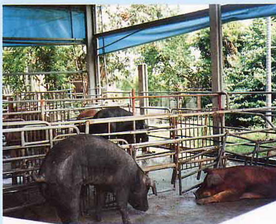
豬場添加綠，看起來格外清潔、恬靜