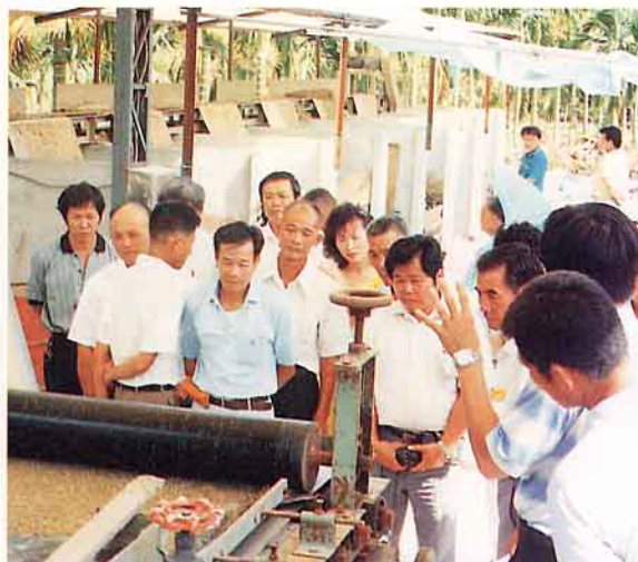
產銷班班員參觀污泥脫水機示範操作情形