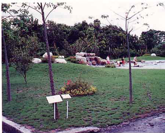
產銷班不定期提供有機肥給社區及國小美化綠化環境，圖為田尾鄉南鎮國小校園景觀

本鄉為全省之花卉中心，班員平常均將猪糞作成有機堆肥，充分提供附近農地之地力改善，並免費協助社區及鄰近學校之環境綠化工作，減少猪糞汙染，亦可達敦親睦鄰，促進地方和諧等共同利益之效果。