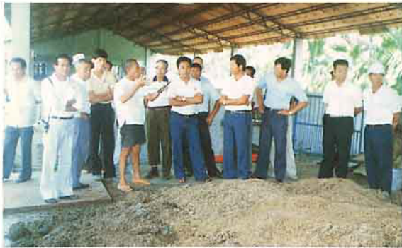
班員參觀豬糞尿處理

行班會聯絡感情及交換飼養心得，並邀請專家作飼養管理技術指導，藉以提昇班員飼養管理知識。