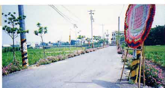
利用有機肥美化綠化社區環境，圖為田尾鄉福田社區

毛豬產銷班之設立，在於輔導產業競爭力，平時必需做好敦親睦鄰工作，免遭鄰近居民排斥，以及對未來加入世界貿易組織之競爭壓力，無時無刻應以提昇飼養管理技術，降低生產成本，期能與國外養豬業競爭，確保養豬事養之永續經營。■