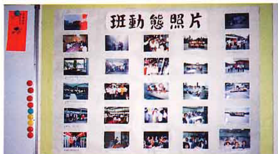
會議室展示的班活動照片

除了養豬場的設備改善，以及重視美化、綠化環境外，第一班的班員不定期的免費將豬糞尿分離物(有機肥)供應給豬