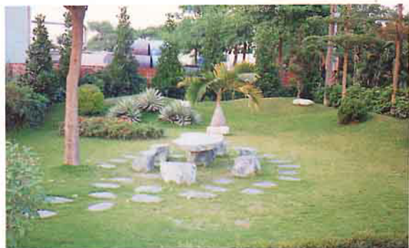
產銷班班員提供有機肥，美化、綠化，社區環境

世界經濟逐漸繁榮進步，台灣的經濟亦隨著國際腳步邁進，在講求經營成本，豬隻飼養由小型副業性質，飼養規模逐漸轉型，養豬戶處於優勝劣汰之競爭情形，且市場豬價起伏波動頗大，對農民之經濟影響彌深，民國68年政府為了解養豬情況，充分掌控市場之產銷平衡，遂組織養