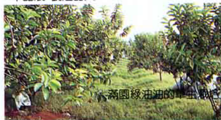
兩圓綠油油的單生蔬菜