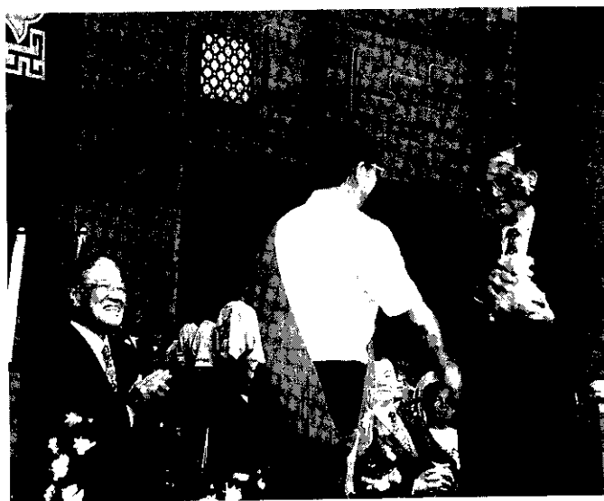
連副總統頒贈樹苗與各界代表