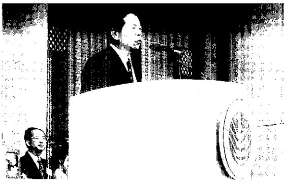
農委會說明「全民造林運動」的意義

其可分為兩項，一為獎勵造林的實施，大幅提高造林獎勵金，由現行每公頃6年僅補助新台幣15萬元調升為20年補助新台幣53萬元，以提昇獎勵造林績效；其二則為針對各類租地造林地、原住民保留地及山坡地宜林地之超限利用者，進行林地的收回，並由各區林管處配合實施造林計畫。希望藉由獎勵的實施與公權力的執行，以增加我國的森林覆蓋率。而在此計畫完成後，將使我國的森林覆蓋率由58.53%增為60.24%，而世界排名亦將由目前第八位提升為第五位。其數據所代表的意義或許不大，但實際上對我們的生活而言，不僅對整個環境的安定、水源的涵養及森林遊樂的提供等，都有很大的助益。