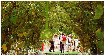
如此可愛的葫蘆，叫參觀的人不心生歡喜也難！