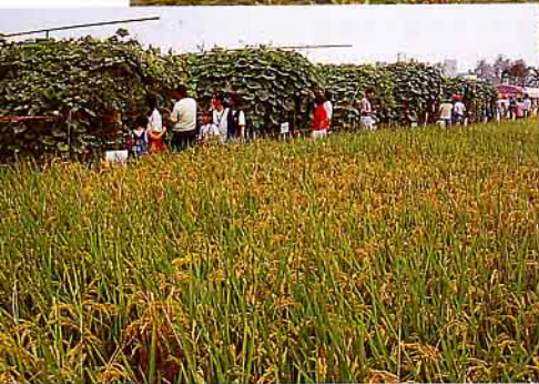
配合區運，到農改場來一趟「農業知性之旅」真有趣！（圖為作物標本區）