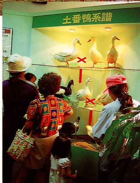
參觀畜牧館的人，看得津津有味