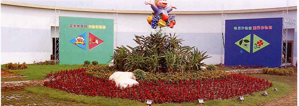
屏東市昔稱「阿猴城」，因此會場中到處有「猴齊齊」的玩偶