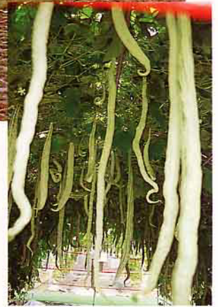
像「蛇」模樣般的蛇瓜