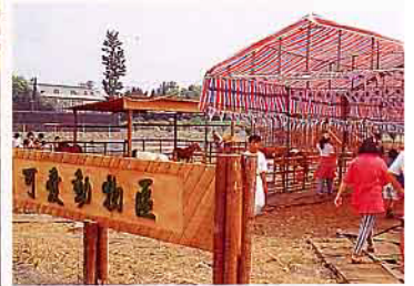
台灣省畜產試驗所安排有「可愛動物

民國85年的台灣省區運會在屏東舉行，為配合此次區運會，在行政院農業委員會和台灣省政府農林廳輔導下，屏東縣政府、高雄區農業改良場和屏東縣農會三