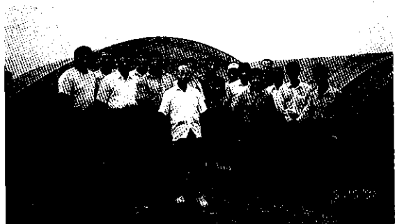
花蓮市蔬菜產銷班來訪合影