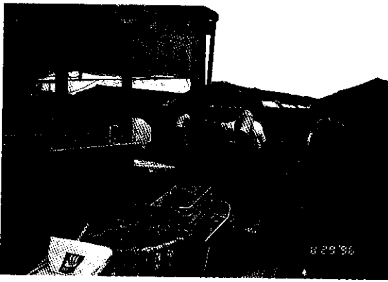
會班長的簡易冰水處理槽

染，再配合生物防治與黃色粘板誘殺蟲害，以確保無農藥污染或農藥殘留，並施用有機質肥料為主，漸漸成為有機蔬菜，使亞硝酸鹽含量減到最低，使消費者“吃得安心、吃出健康”。