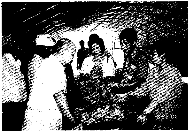
會班長說明採收葉菜的技巧

2. 共同運銷站的成立，各班員每日採收之蔬菜，經由採收處理後集中於班集貨場，於次日清晨統一運送至各批發站或直銷站，以節省運銷成本。