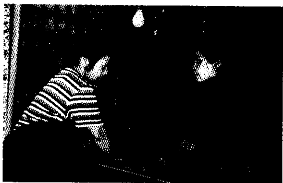
曾班長夫婦洗菜夫唱婦隨