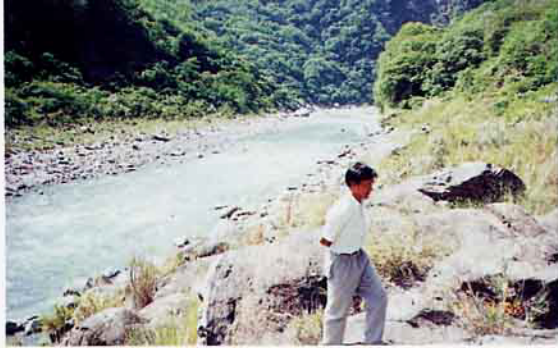
有了綿延青翠的山谷，與清澈的溪流，才是美麗寶島臺灣的命脈（新武呂溪上游一景）

們的敘述，早期大坡池水域大多為湖沼濕地，雜生濕生和水生植物，如水燭、布袋蓮、水丁香等，池邊爛泥區常為農民終年長期遍植著菱角、茭白筍等作物，池內盛產著鱸鰻、草魚、鯪魚、鯉魚、本土鯽魚等各類淡水魚蝦及貝類，同時大坡池本身亦是『台東縱谷』內，頗為少見的大型湖沼區，特殊的地理區相，豐富而充足的食物源，加上沒有太多的人為干擾，因此有不少的紅冠水雞等野生留侯鳥在此駐留棲息，而形成特殊的生態景觀，可說是一處鳥類的『伊甸園』，也是人們賞鳥的絕佳地點。