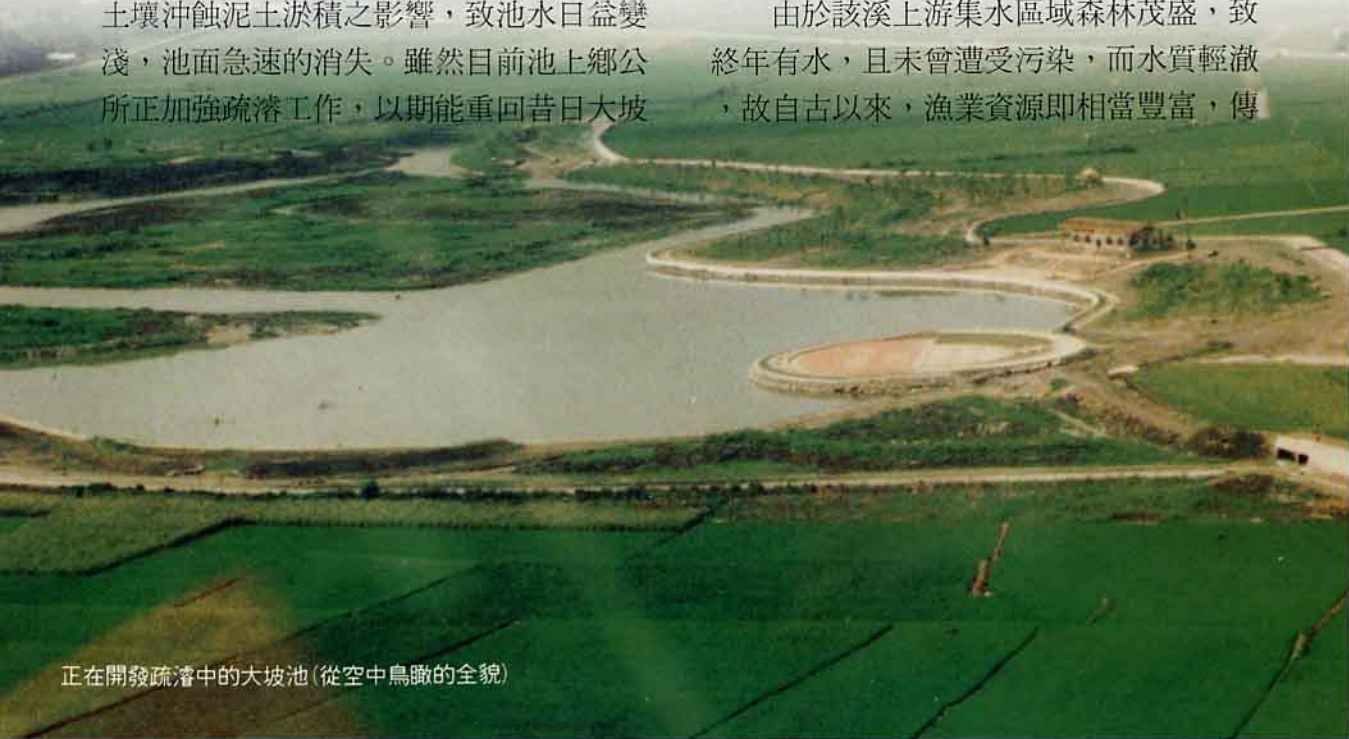
正在開發疏濬中的大坡池（從空中鳥瞰的全貌）

由於該溪上游集水區域森林茂盛，致終年有水，且未曾遭受污染，而水質輕澈，故自古以來，漁業資源即相當豐富，傳