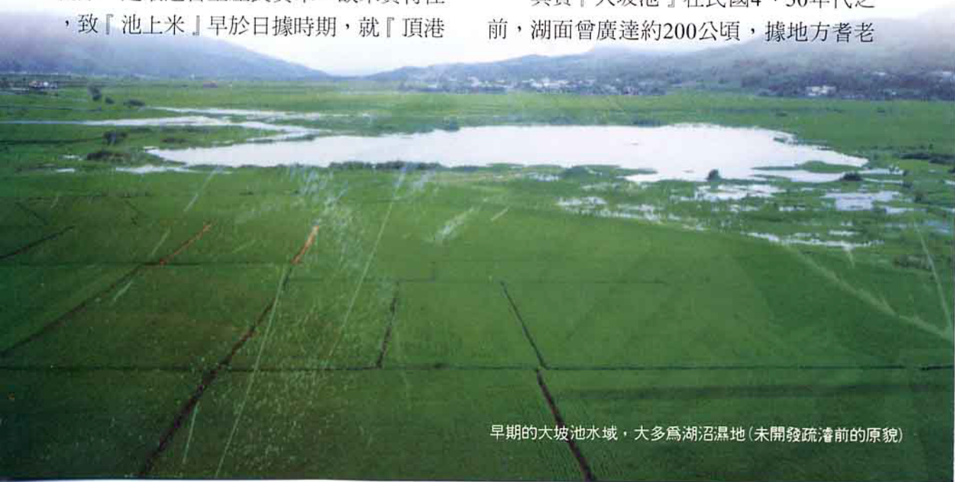
早期的大坡池水域，大多為湖沼濕地（未開發疏濬前的原貌）