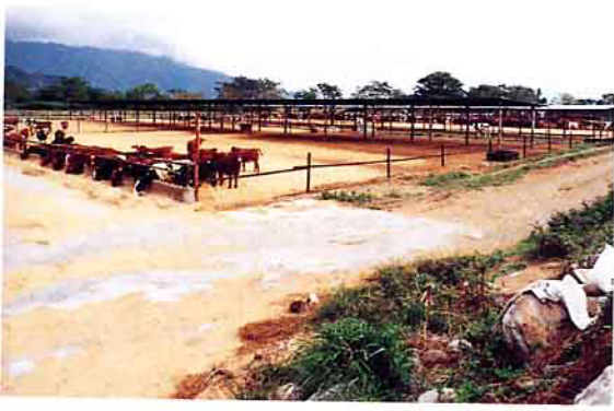
肉牛飼養已躍升為池上鄉具有代表性畜牧產業

東縣東海岸瀕臨太平洋的東河鄉、成功鎮等，故地理位置頗為優越，早期時即為商旅歇腳休憩之處，致美名早已名聞遐邇。