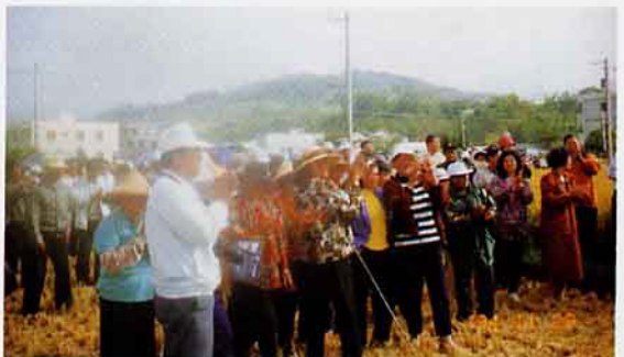
有關良質米產銷改進觀摩活動，頗受池上鄉親父老的青睞，參加情形非常踴躍。

至於環繞在大坡池四週的耕田區域，廣達2,000餘公頃，以順著台東縱谷平原南北雙向開闊漸遠之勢，連接著田連阡陌的田園景緻，給人有天地悠悠的感覺，在春夏之際，大地形成一片綠油油，而秋冬來臨時，金黃色的稻穗再度映入眼中，就