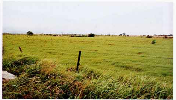
台糖公司所屬的大規模牧場，將逐步配合觀光休閒業的發展，開發為歐式跑馬場