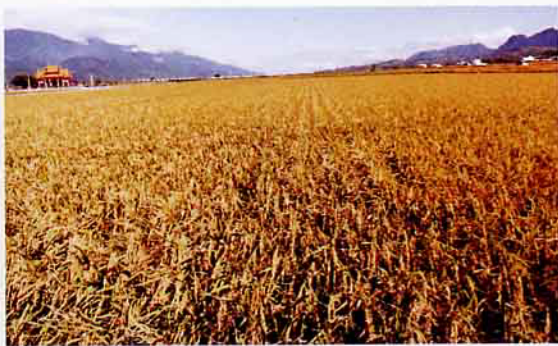
環繞在大坡池四週的良田廣達二千餘公頃(左邊是中央山脈，右邊是東海岸山脈)

是收穫的季節，使一向寧靜的農村，一下子又熱鬧起來。最近這幾年來，農民都會利用農田休閒期遍植油菜綠肥，尤其當大地綻出金黃色的花海時，田園的景觀更是美不勝收，似此美景對於久居都市塵囂的人們，應有絕對的吸引力。