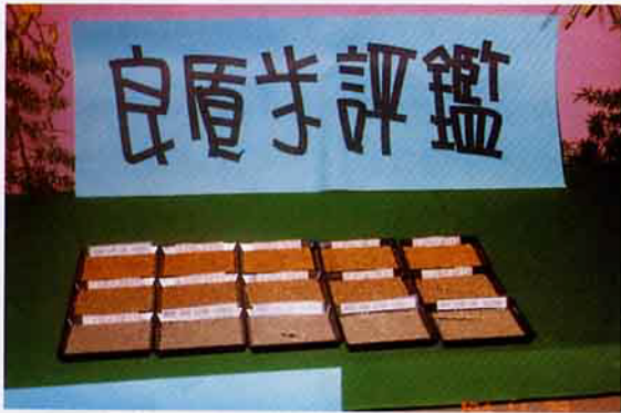
台梗2號，高雄139號等品種的水稻，是池上鄉良質米推廣的主力部隊

統上係屬於原住民中布農族的漁獵區域，如依據『台灣省特有生物保育中心』，及『台東師範學院環境教育中心』等單位，最近幾年的調查結果，可瞭解到諸如東部特產的國寶級魚類有高身鏟頰魚、何氏棘鯉、苟池氏細鯽、日本禿頭鯊、褐吻蝦虎、平額絨螯蟹等，皆能看到魚兒優遊的蹤跡。