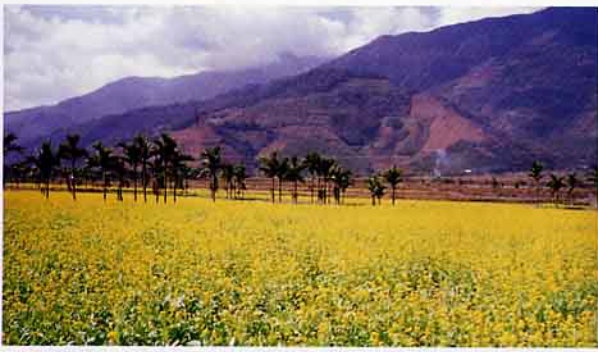
秋冬之際的台東縱谷平原，大地呈現一片金黃色的油菜綠肥花海