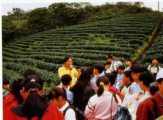
水土保持義工在戶外水土保持教室為小朋友做解說