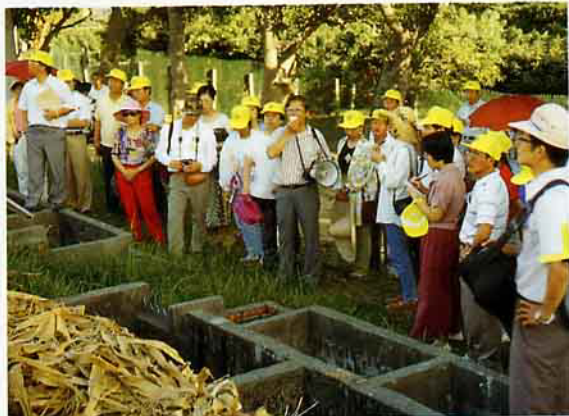
培訓義工時，帶領準義工們作實地的參觀