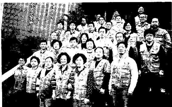
我國第一屆水土保持義工訓練結業的解說員們