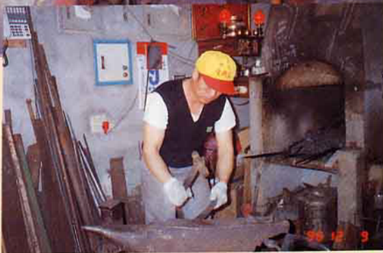
打鐵製造噪音，因此當初被搬遷到人煙罕至的南興街