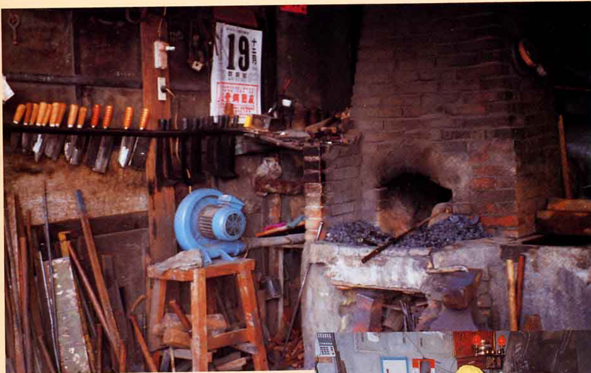
這種設備及行業，已經落伍了嗎？