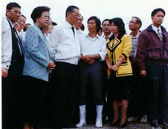
連副總統兼院長赴桃園縣現場視察處理情形

→ 七. 冷凍肉加工廠業務銳減時所遣散之勞工，於業務恢復正常營運時，由行政院勞工委員會輔導其所需人力，原遣散外勞配額准予恢復。