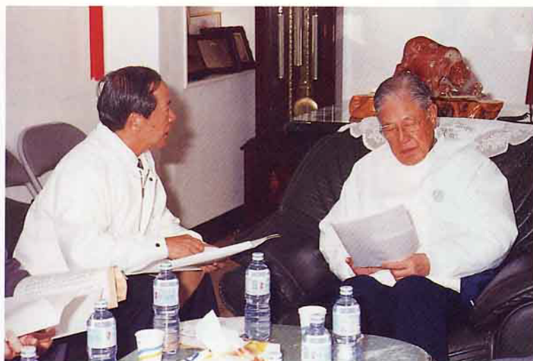
邱主委向總統報告疫情