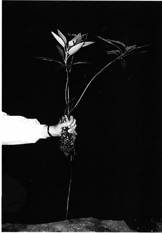
圖三、在長根枝條長根部位直下方剪斷，即可得到新的長根植株 Fig. 3. New plant growing on its own roots could be got by cutting the just below the adventitious root initiating part of the new rooting shoot.