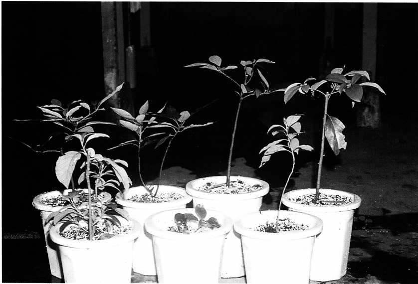
圖四、盆栽於塑膠盆之長根植株可順利發育 Fig. 4. Rooted plant could grow vigorously after potted in plastic pot.