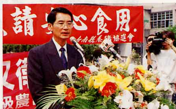
農林廳陳廳長促請廳裡全體員工總動員外，也促請相關單位「大動員」大合作