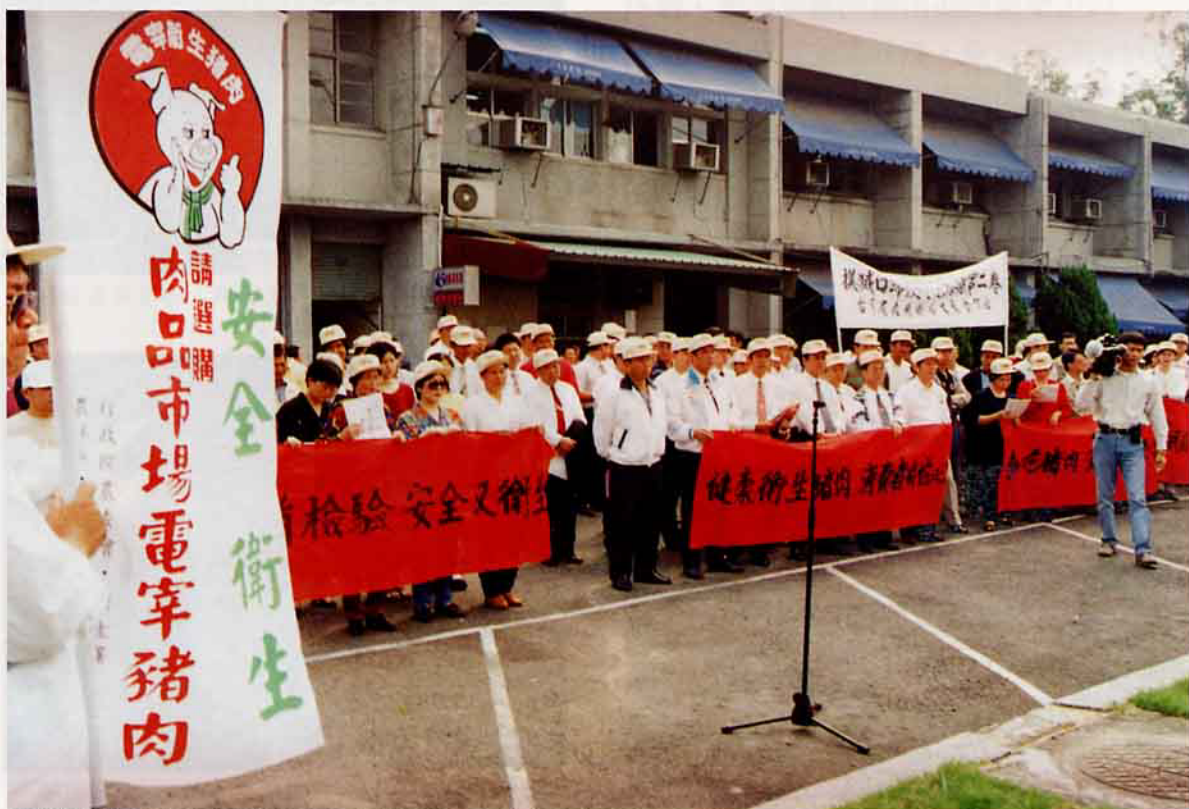
養豬團體在3月28日發起「建立產業新形象，確保豬肉品質」活動