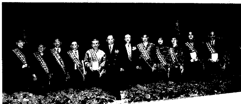
桃園縣政府葉局長，與農會吳理事長頒獎表揚模範農民