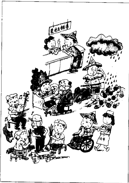
簡化老年農民福利津貼申請及發放手續之作業流程圖