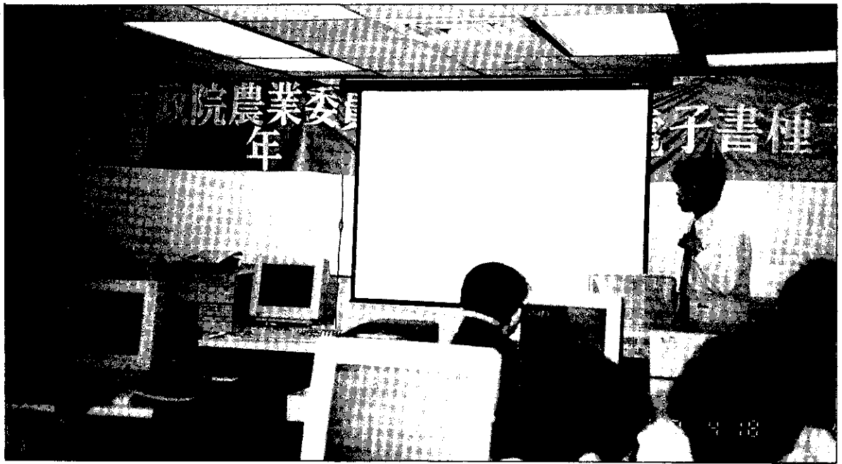
學習使用電腦，已經是不可抗拒的趨勢