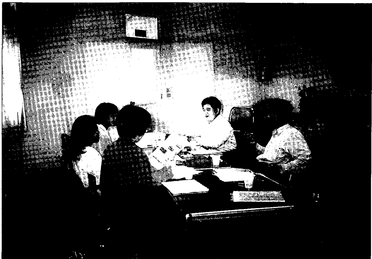
和產銷班詳細溝通之後，專業人員可以設計出適用的電腦體系

大家都在談論網際網路（Internet），它究竟有什麼魅力？它跟農友們又有什麼關係？以下我們就來簡單介紹網際網路（Internet）對產銷班的好處。