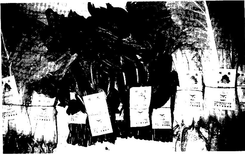
「吉園圃」安全蔬果， 認識它，選購它。

拿「吉園圃」的蔬菜。如果今天「吉園圃」標章的蔬菜佔大多數，沒有「吉園圃」的就不會被接受，「吉園圃」的蔬果銷售量就會提高。